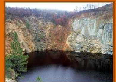
Las dimensiones de boca de la corta, con forma oval son aproximadamente: 1.225 metros de largo, unos 910 metros de ancho y casi 360 metros de profundidad.