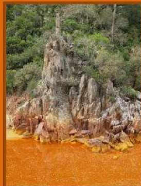
Caprichos de la naturaleza, como La Puya, formación rocosa que proyecta una sombra en forma de Virgen sobre las aguas rojizas del Tinto en la época del estío, sorprende a propios y extraños a lo largo de la ruta.