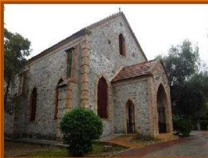
Iglesia del Barrio Ingles de Bella Vista ( Riotinto). Finales del siglo XIX

Calzado y ropa cómodas acordes con la época del año y las condiciones meteorológicas, recomendamos zapatos de trekking, pantalón largo, forro polar y chubasquero (dependiendo de la climatología). Comida y agua abundante. Es recomendable llevar una cámara fotográfica para tener un recuerdo de la actividad.